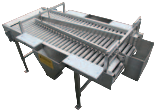
Rollenverlesetisch mit Auslesetrichern, Trennleisten und Schneidbrettern

Der Rollenverlesetisch ist für alle Arten von Wurzel- und Knollengemüse geeignet. Bei länglicherer Ware wie z.B. Karotten ist es wichtig, die Zuführung so zu gestalten, dass die Feldfrüchte quer auf den Rollenverlesetisch übergeben werden. Alternativ können für solche Ware auch Verlesebänder eingesetzt werden, die ebenfalls von der Firma Schneider hergestellt werden.